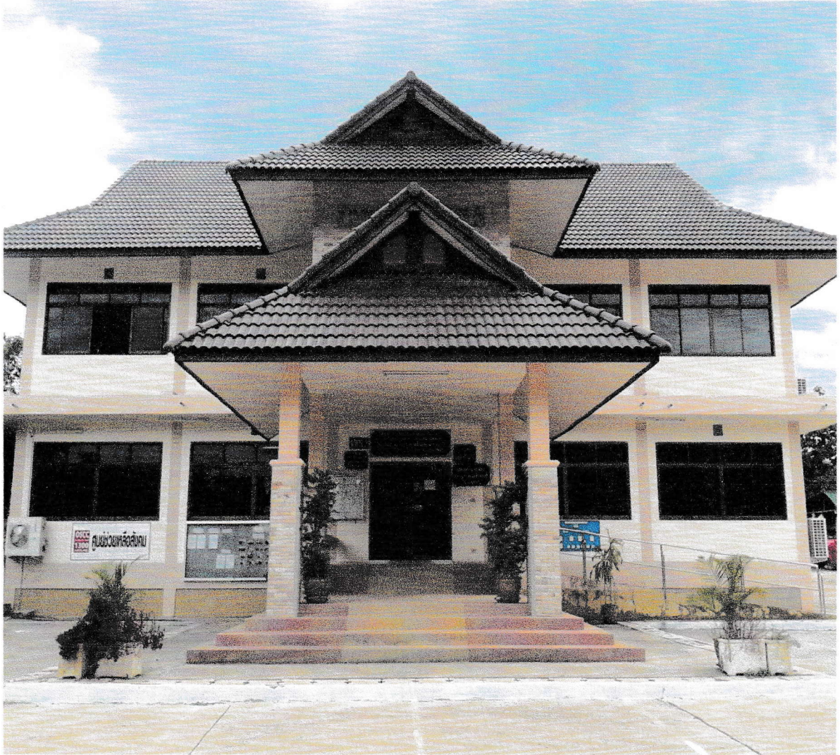
เทศบาลตำบลบ้านตำ อำเภอเมืองพะเยา จังหวัดพะเยา